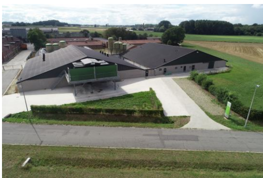
Campus Porcino ILVO

El Instituto de Investigación de Flandes para la Agricultura, la Pesca y la Alimentación (ILVO) es un instituto de investigación científica independiente del Gobierno de Flandes. ILVO se asocia con otras organizaciones a nivel nacional e internacional para trabajar hacia una agricultura, pesca y procesamiento y distribución de alimentos más sostenibles. La misión de ILVO es clara y moderna: generar conocimientos que respalden la producción de suficientes alimentos saludables y variados para una población mundial de 10 000 millones de personas sin sobrepasar de los límites de nuestro planeta. Para lograr esta misión, ILVO realiza investigaciones multidisciplinarias, innovadoras e independientes. ILVO construye el conocimiento básico y aplicado necesario para mejorar los productos y métodos de producción, para garantizar la calidad y la seguridad de los productos finales y mejorar los instrumentos de política que constituyen la base del desarrollo sectorial y la política rural.